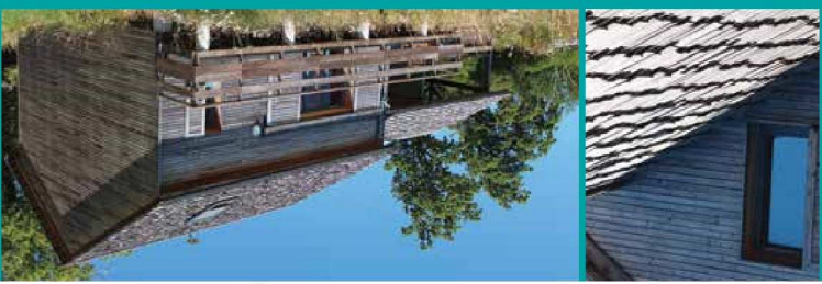
61020 - Juin 2016 - 2016