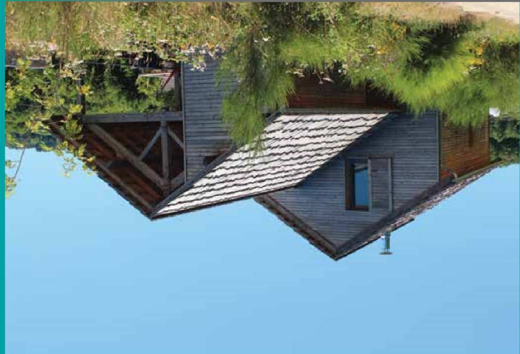
CATÉGORIE : LOGEMENTS INDIVIDUELS